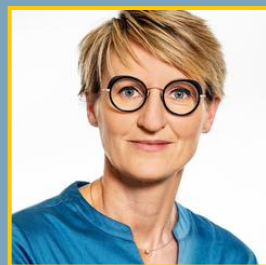
Boris Rhein Tessloff Verlag (WAS IST WAS)