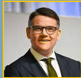
Boris Rhein Hessischer Ministerpräsident

“ Political X Change kann junge Menschen motivieren sich für unsere Demokratie einzusetzen. Das ist wichtig für die Zukunft unseres Landes! ”