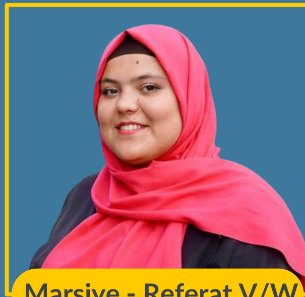
Marsiye - Referat V/W